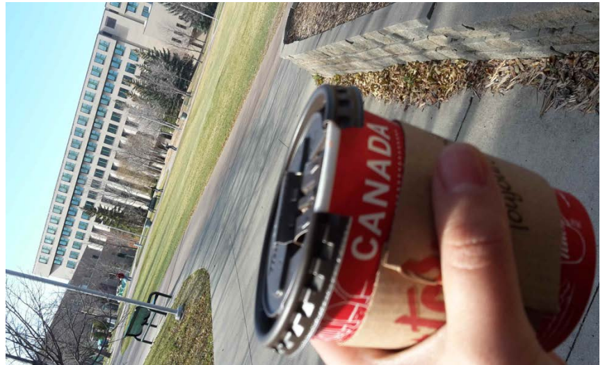
University of Regina | Regina, SK, Canada