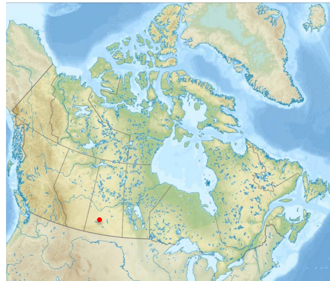
Relief map of Canada.png, von Nzeemin - ETOPO1, Yug and STyx Eigenes Werk, lizenziert unter CC BY-SA 3.0, https://de.wikipedia.org/wiki/ /Kanada#/media/File:Relief _map_of_Canada.png